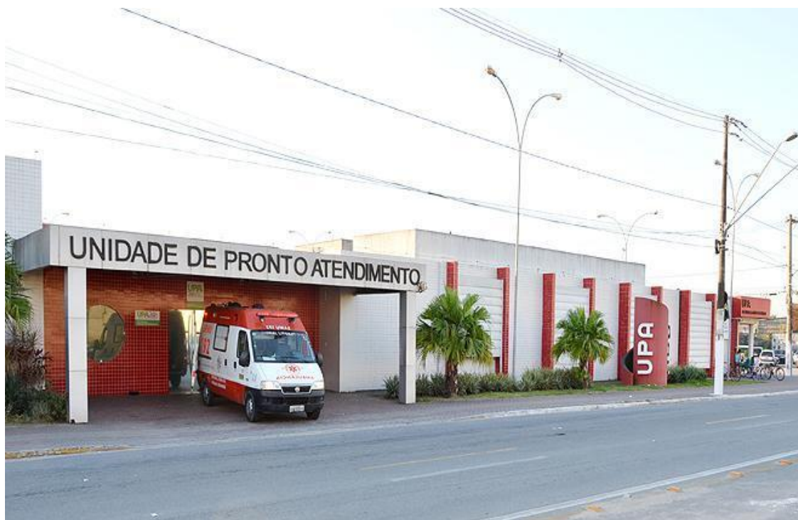
Figura 4. Fachada da Unidade de Pronto Atendimento Doutor Charles Antunes Bechara (UPA Samambaia)

Porte III, conforme habilitação aprovada pela Deliberação CIB/SP nº. 38/2009, de 29 de junho de 2009.