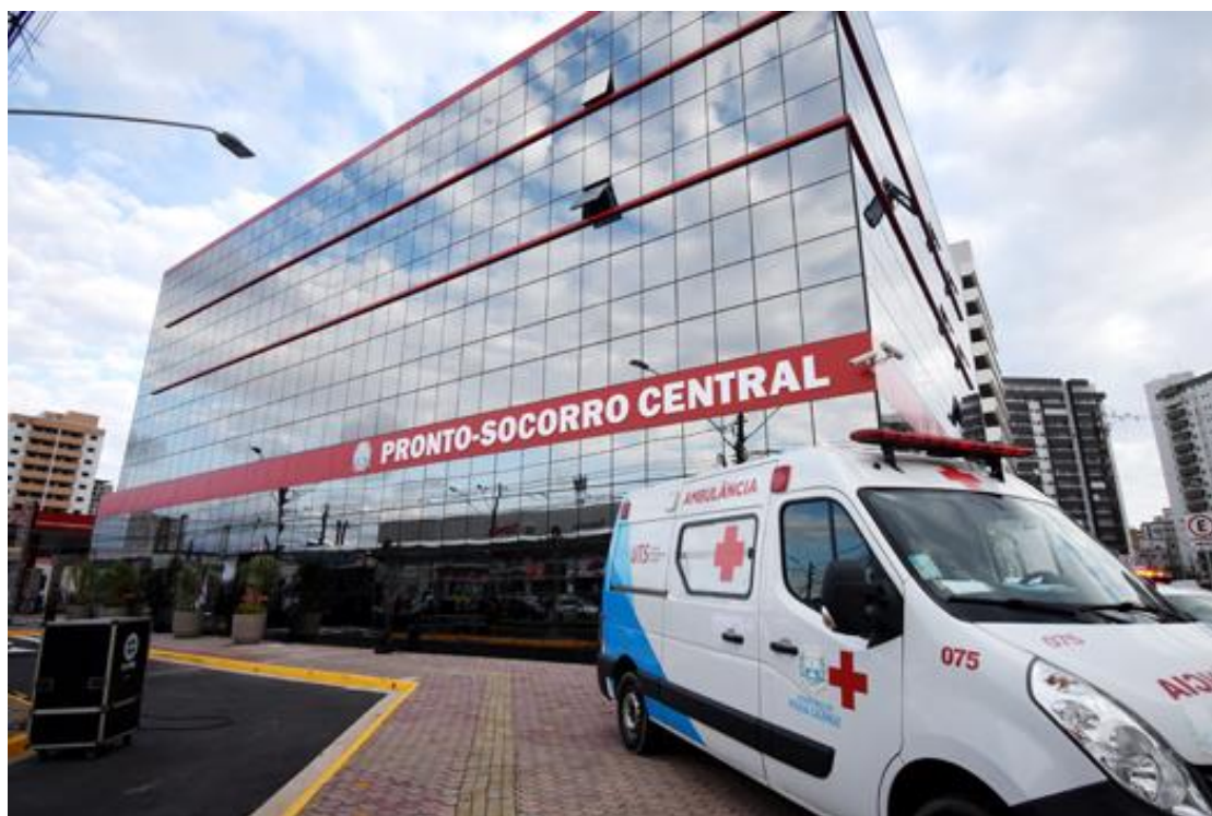
Figura 3. Fachada externa do Pronto Socorro Central.

Em seguimento a meta 2.2.3. do Plano Municipal de Saúde 2022-2025, que busca qualificar o acesso à média complexidade hospitalar de forma articulada com as Redes de Atenção à Saúde, através dos projetos vinculados à expansão da estrutura física da Porta de Entrada almejados junto a 10ª Conferência Municipal de Saúde, de 31 de julho de 2021 (Decreto Municipal nº 7266, de 01 de julho de 2021) e as propostas do Plano de Ação de retomada da assistência não COVID – biênio 2021/2022, deflagra-se nesse novo Plano Operativo Anual 2022 a repactuação da Expansão da Porta de Entrada da RUE/RRAS 07 junto ao endereço complementar na Avenida Presidente Kennedy, 1497/1501, bairro Guilhermina, a qual é destinada ao atendimento da demanda espontânea da Porta de Entrada tipo geral do Complexo Hospitalar Irmã Dulce, conforme série histórica publicamente disponível no DATASUS.