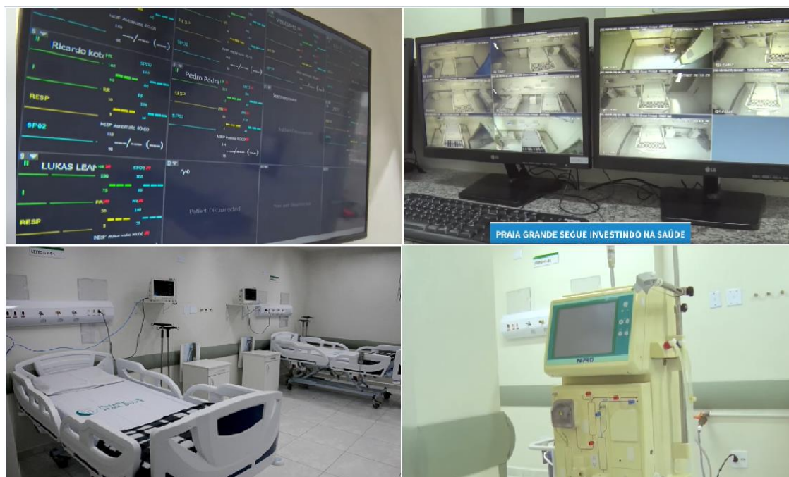
Figura 2. Imagens da estrutura dos 10 novos leitos de UTI tipo 2 Adulto.